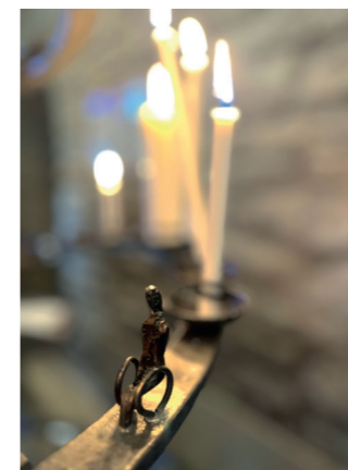
En modern ljusbärare med fina detaljer är tillverkad av Nordens enda kvinnliga mästersmed Smedja Therese.