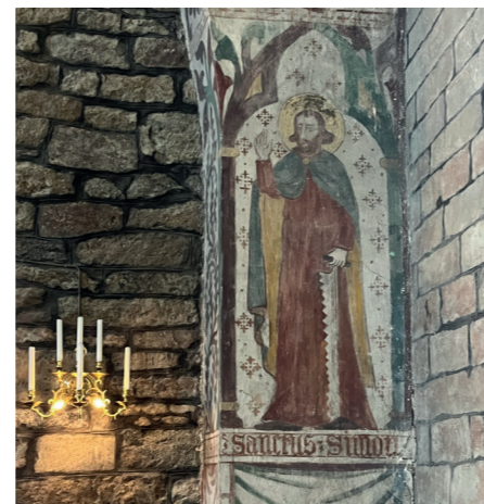
Ett av de kvarvarande originalmålningarna föreställer Sankte Simon.