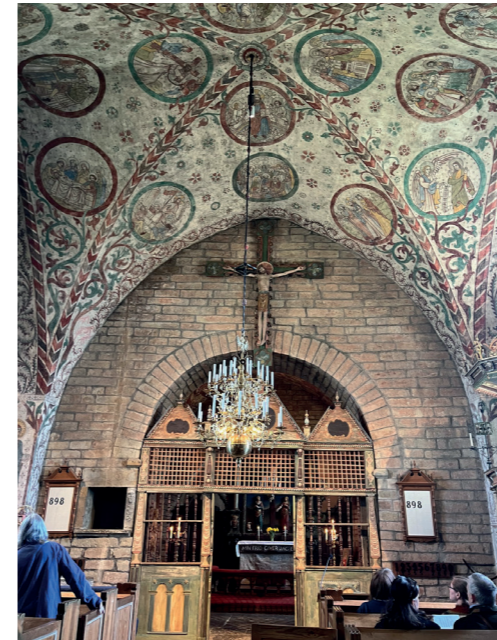
De första takmålningarna kom till på 1300-talet och överkalkades på 1700-talet, men vid restaurering 1901 återskapades målningarna i gammal stil.