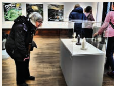
Med ett aktivt liv och ett meningsfullt engagemang kan vi uppnå ett gott åldrande.