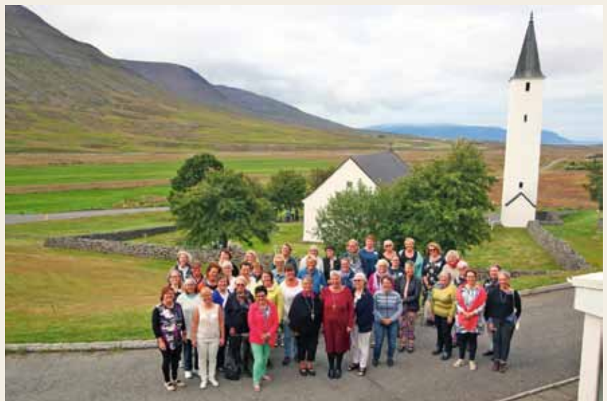
De nordiska kvinnorna – vid Hólars domkyrka.

Lagerlöf, vi utforskade därefter de upplevda intrycken genom bildskapande. Vi var många som uttryckte vikten av att agera, att våga ta steget, göra det oväntade som inte följer normen, och därigenom hjälpa sina medsystrar att hitta glädje och mening i sina liv.