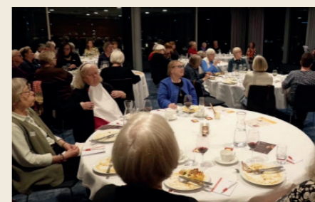
Välbesökt samling i Lund.

De har ordnat pilgrimsvandringar med kvinnligt perspektiv och kvinnofrukostar med information om de olika internationella kontakter som