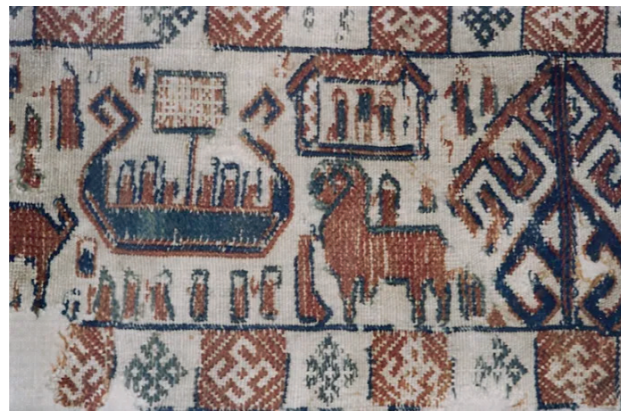
Mycket av gamla kyrkliga textilier är bevarade. Till vänster en detalj ur Överhogdalstapeten som kommer från Vikingatiden och hittades i en kyrka. Till höger en detalj ur det bräm, från högmedeltid tillverkat i England, som hittades i Skå kyrkan på Ekerö och nu finns bevarat på Historiska museet i Stockholm.