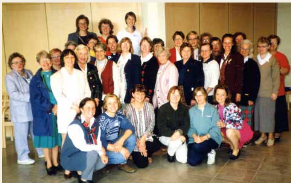
Från KviSks årsmöte i Åkersberg i Höör 1996.

Se bilden som vi hittade i KviSks arkiv hos Svenska kyrkan, Uppsala!