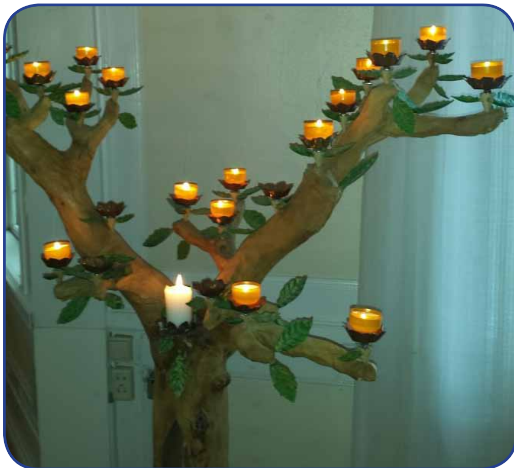
Förbönsträdet, Vårsta bönsal.